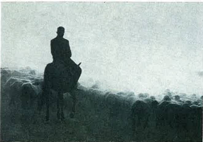
Les têtes de moutons Karakoul. The heads of Karakul sheep

North of Samarkand the Kirilkum desert extends thousands of miles until the steppes of hunger. There, whole families live a nomad life there, carrying their felt tents from one water point to another, followed by their flock of sheep, by their horses and camels. Their only reason to live, in this desert burnt by sun and salt is astrakan fur sent to countries of coolness and rain so often a subject of their dreams.