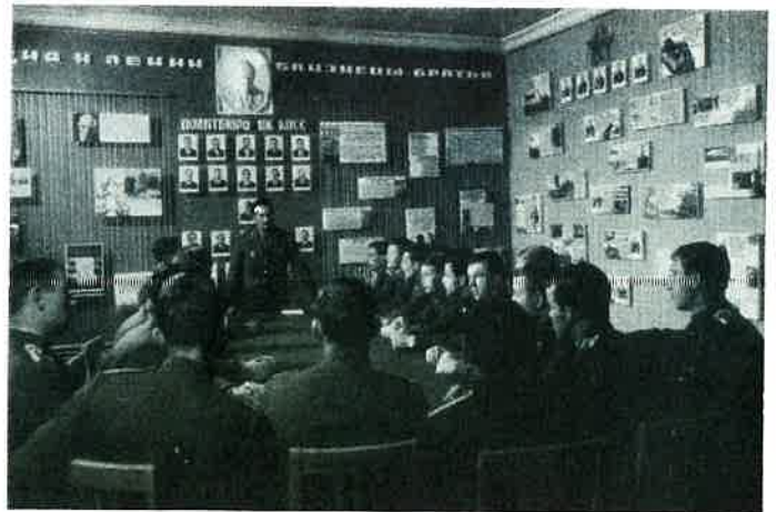
Cours de Marxisme - Léninisme à l'académie militaire de Moscou Lesson in Marxism - Leninism at the Military Academy in Moscow