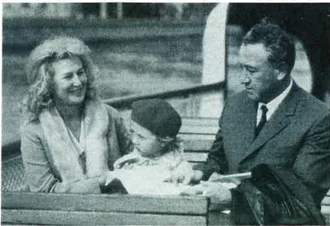
romenade sur la Moskwa in boat on the Moskwa

Once every week, a pilot flies his Tupolev 114 from Moscow to Tokyo. Three days here, and three days at the other end. An encounter of two different worlds and the life of a couple, he dreaming of the grey waters of the Moskwa whilst sipping a beer in the frenzy of Ginza, she dreaming of luxury amidst the quiet conformism of moscovite life.