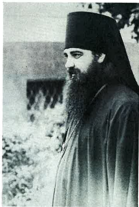
Moine du monastère de Zagorsk Monk of Zagorsk Monastery