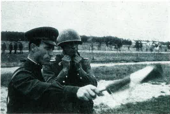
Exercice de tir aux environs de Moscou Shooting exercises near Moscow

A young candidate officer in one of the Moscow's world famous military academy : the academy of the Supreme Soviet. How tomorrow's Soviet Army technicians are schooled, in what spirit, by which methods and what is the ideology impressed upon these heirs to the once popular and revolutionary Red Army.