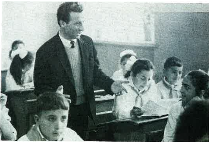
Erivan - une leçon de français Erivan - a lesson in French

Children learn three languages before the age of ten, but weddings are still celebrated as they were five hundred years ago.