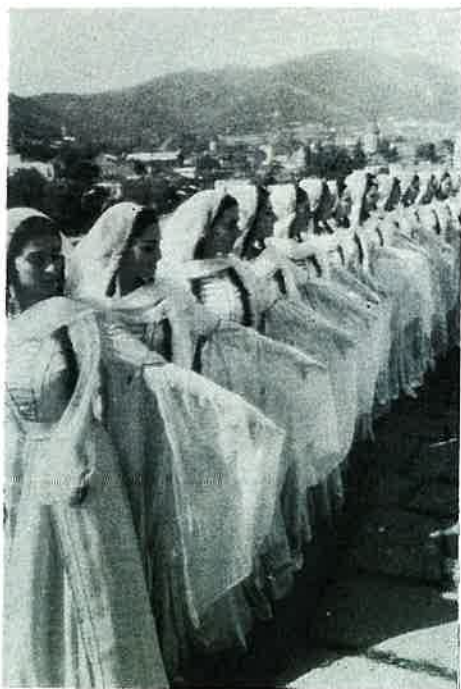
Dances à Tbilissi Dance in Tbilissi!

It is the land of wine, where people are judged by the way they drink and carouse, where women are beautiful and where dance is ever present.