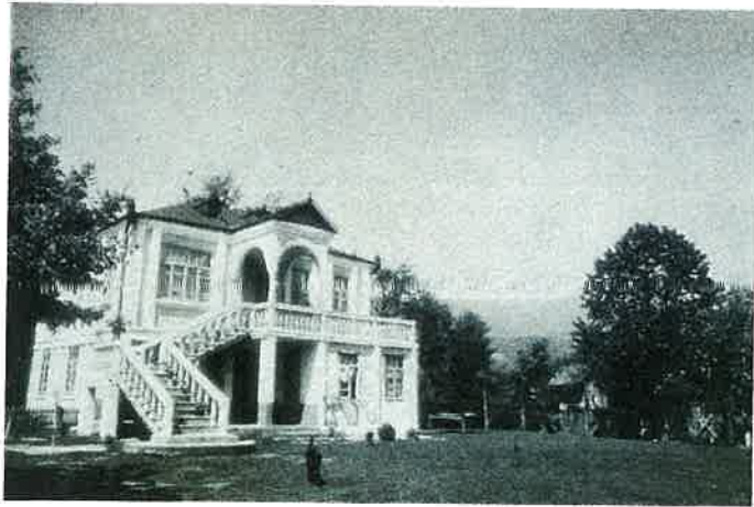
Architecture Abkhazie Abkhazian architecture

A kolkhozian born under the reign of Tsar Alexander the II, still carrying the long dagger and wearing clothes as worn by caucasian horseriders at the beginning of the century, centenaries merrily drinking their quart of wine, an astounding choir from another century; all this in a land of plenty, where life is sweet to be lived.