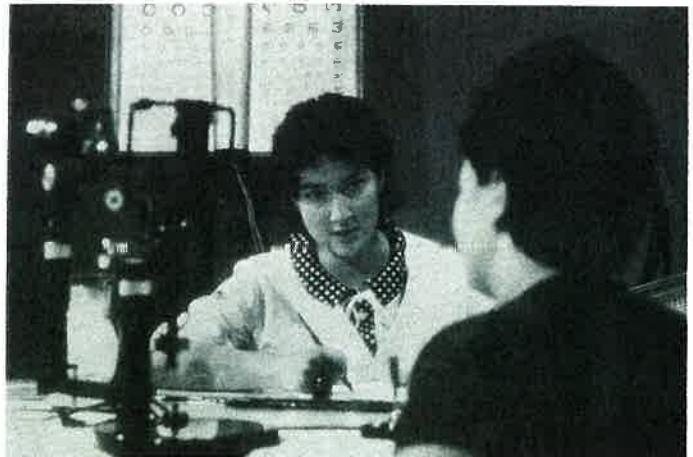
La médecine en URSS A medical profession in the USSR