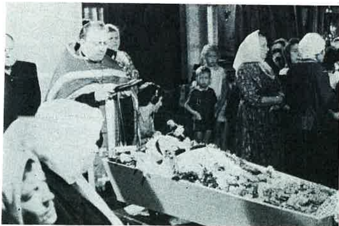
Messe des morts à Vladimir. Requiem mass in Vladimir

The true image of the Orthodox church in the Soviet Union.