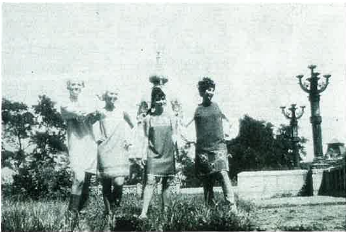
Présentation de mode à Kiev Fashion show in Kiev

A young woman, studying history at Kiev university has a not very common profession in the Soviet Union : a fashion mannequin. But Haute Couture is a strange thing in the Soviet Union. It is experimental art and young mannequins have to go from Kolkhoz to factory for fashion shows accompanied by conferences with a view of forming the taste of workers and peasant girls.