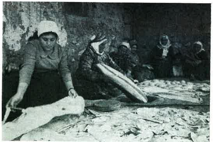
Fabrication du pain arménien The making of Armenian bread