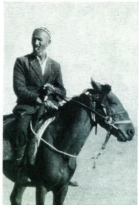
Dans le désert d'Ouzbékistan In the Uzbekistan desert