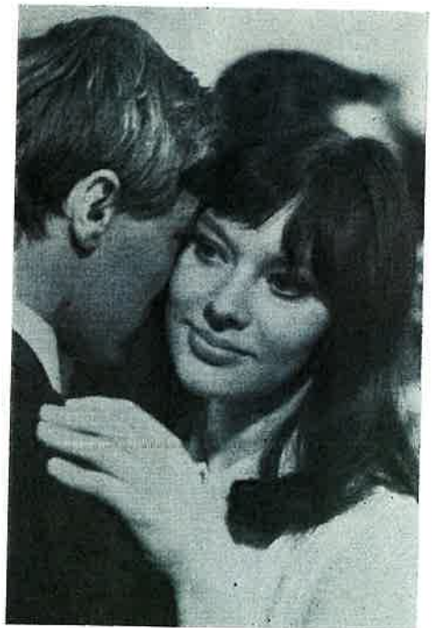
Une Natacha du XX m e siècle. A 20th century Natacha