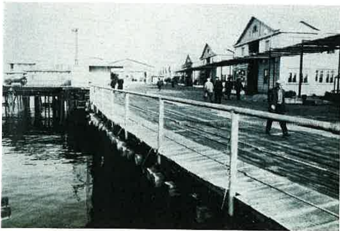
Les « Pierres Noires » sur la Mer Caspienne « Black Stones » on the Caspian Sea

Ships run aground turned into workshops, and houses, hundreds of derricks linked together by 180 miles of estacades, a background of beams, of iron and rust, the daily setting for some thousand oil workers.