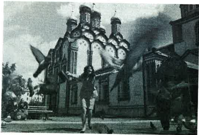
Promenade dans Moscou A stroll in Moscow

But the life of a star in Moscow is very different from the one in the western world.