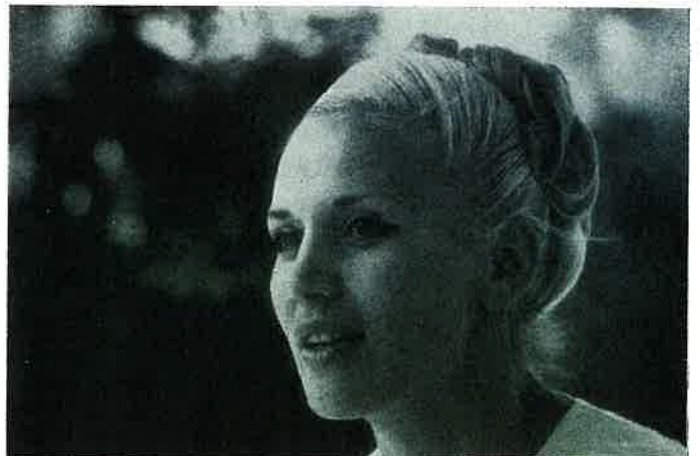
Une beauté bien Ukrainienne A .very Ukrainian beauty