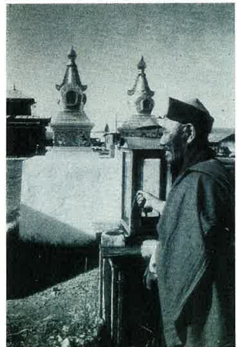
Monastère Bouddhiste en Sibérie Buddhist monastery in Siberia