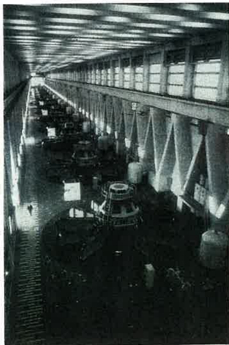
Turbines du barrage de Bratsk Turbines of the Bratsk dam

But even so his life remains the life of Siberian pioneers.