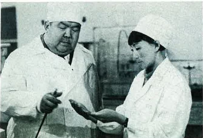
Cours de chimie à Oulan-Oude Lesson in chemistry in Ulan - Ude

An ethnical minority east of Lake Baikal : Buriats, a mongol race of the Soviet Union. A little town, Ulan Ude, near the outer mongolian border. A young girl is attending courses at the Agronomical Institute and intends to become a veterinary doctor. Fishing on Lake Baikal, the marvel of Siberia, and a visit to the monastery of Ivolga-Datsan, a lamasery where the Tibetan Buddhist cult is still being celebrated.